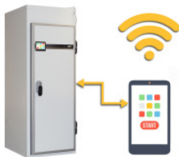
Touchscreen 7" con porta ethernet per controllo da remoto via wifi Touchscreen 7" with ethernet connection for remote control via wifi