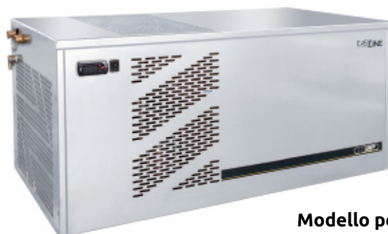
Modello pensile Wall-mounted model PR 100/E - PR 100 R/E