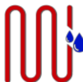
Kit riscaldamento su richiesta Warming kit on request