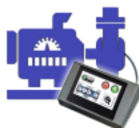
Pompa autoclave + contalitri 'dosakit' con touch screen Automatic pump + 'dosakit' water meter with touch screen