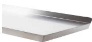
Piano di lavoro inox con alzata Stainless steel top wall shelf