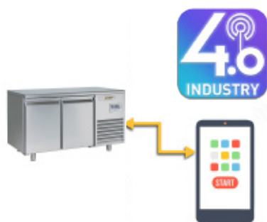
Predisposizione 4.0: Touchscreen 7" per controllo da remoto Predisposition 4.0: Touchscreen 7" for remote control