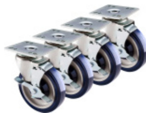
4x ruote in acciaio 4x steel cartors