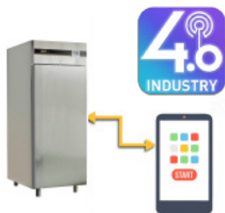
Predisposizione 4.0: Touchscreen 7" per controllo da remoto Predisposition 4.0: Touchscreen 7" for remote control